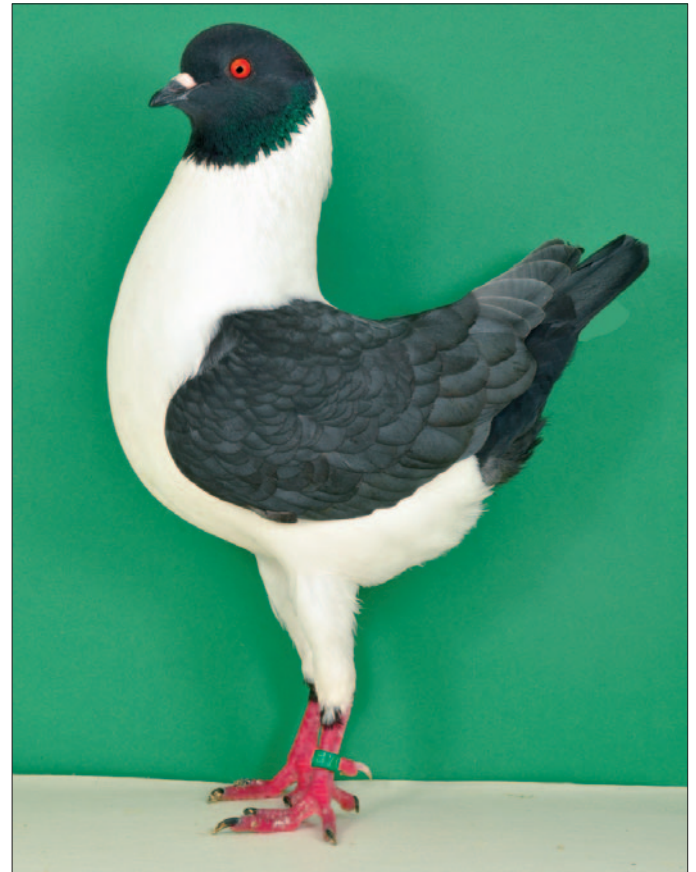
0,1 V 97 KVZP HSS Straßkirchen 2018 Günter Zanger - RP

Bei der Bewertung müssen allerdings die Schwierigkeiten der Andalusierfarbe in Verbindung mit der Gazzi-Scheckung Beachtung finden. Die Nackenzeichnung sollte nicht zu tief reichen. Die Augenfarbe wird ebenso intensiv wie bei den Schwarzen gefordert. Die Augenränder müssen fein und unauffällig sein.