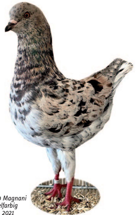
1,0 Magnani vielfarbig Jg. 2021 Klaus Roth – CR