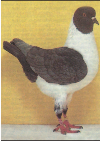
0,1 Neuzüchtung SG VDT Ulm 1993 Horst Friedrich - KS

bringen alle Zuchtpaare, je nach Zusammensetzung, immer ca. 25-50 % an schwarzer Nachzucht. Reinerbige Andalusier bringen in Verbindung mit Schwarzen zu 100 % andalusierfarbige Nachzucht.