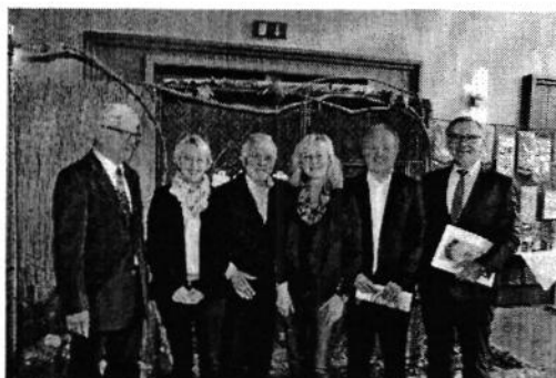
Rundgang mit Ehrengästen bei der Kreisschau

Der KV Miltenberg war über das Wochenende, anlässlich der EE Europaschau, in einer von Wolfgang Mai vom GZV Weilbach organisierten Reise in Metz. Es war für viele ein besonderes Erlebnis ihre Tiere dort zu präsentieren.