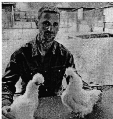
Europameister Markus Trapp