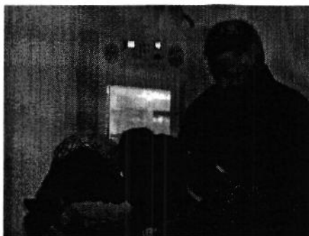
Kükenschlupf im Kindergarten Oberelsbach mit 21 Kindern