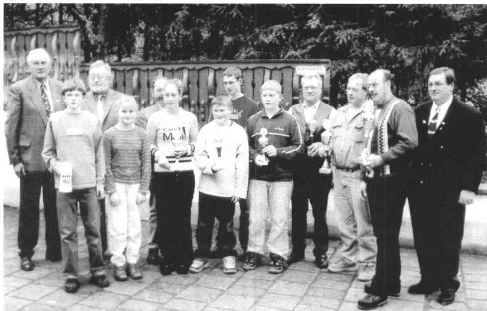
Kreismeister und Kreisjugendmeister in KV Würzburg