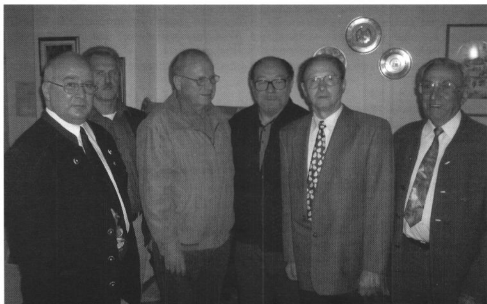
KV Aschaffenburg. Die Bayerischen und Deutschen Meister 2003