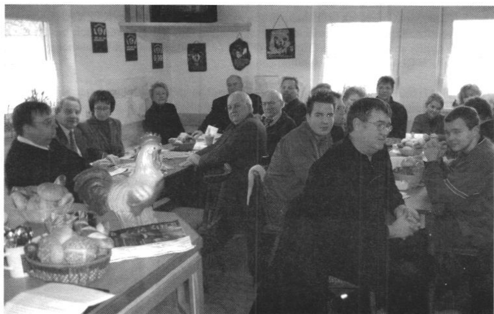
Eröffnung der 1. offenen Mönchberger Ziergeflügelschau mit angeschlossener Fränkischer Ziergeflügelschau