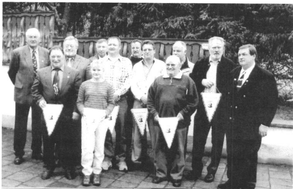
Bayerische Meister KV Würzburg

Auch hier möchte ich herzlich gratulieren!