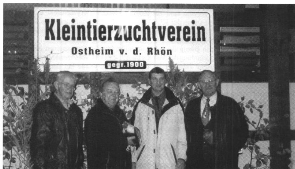
Eröffnung 11. Kreisflügelschau in Ostheim/Rhön