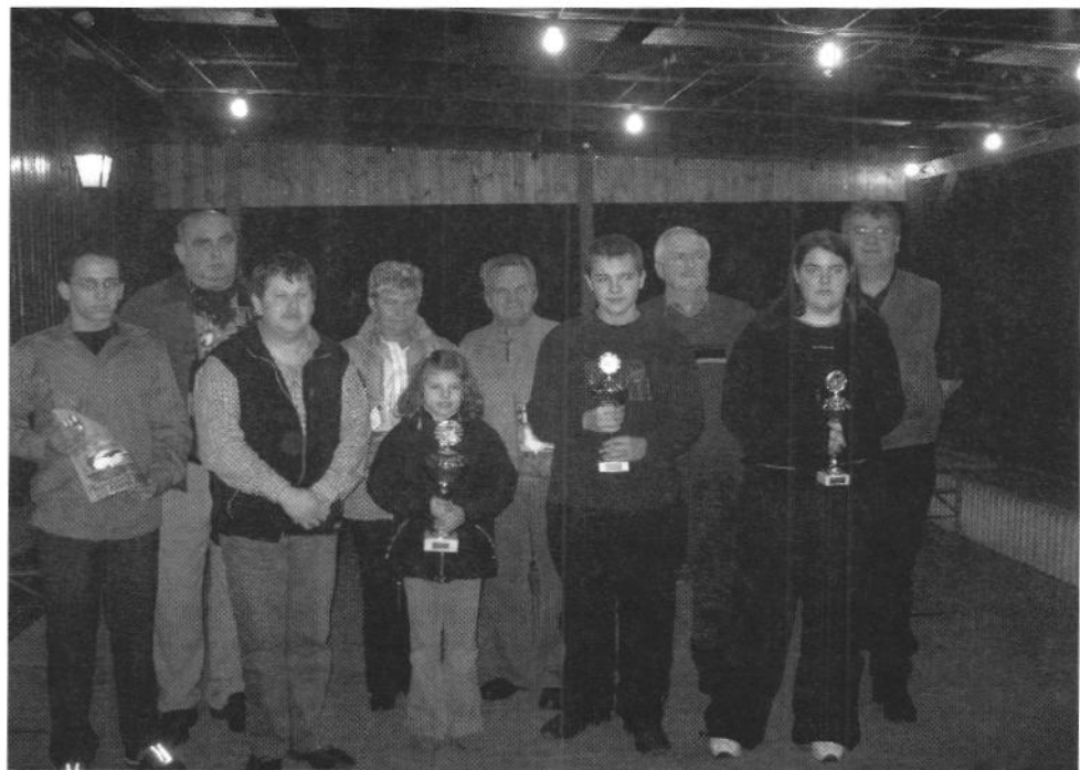
Kreismeister und Kreisjugendmeister